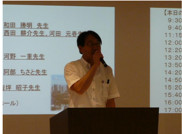
開会式のひとつま：開会宣言