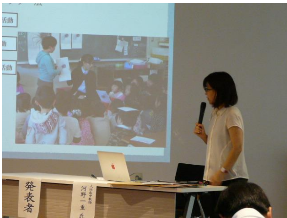
「わくわくかんしょう教室」 図画工作科