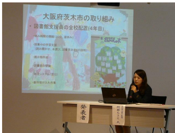
「読書感想画の指導 —様々な読書活動を通して—」