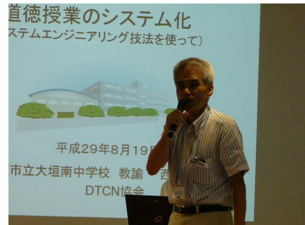
「道徳の授業のシステム化 —その可能性と課題—」