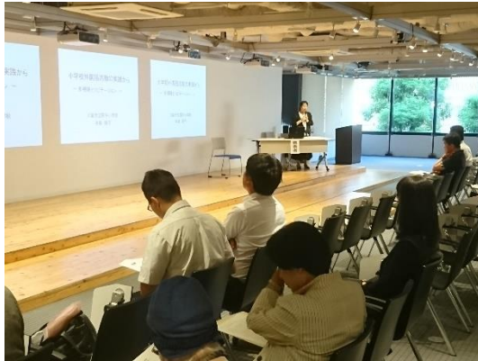
小学校外国語活動からの実践 —多視聴とリピーテーション—