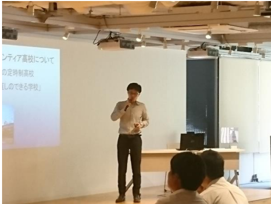
「人物“吉田松陰”をテーマにした対話的授業」 高校歴史