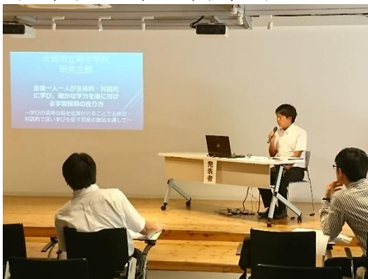
「主体的な学びを目指す授業ーバレーボールの授業の中でー」 中学体育