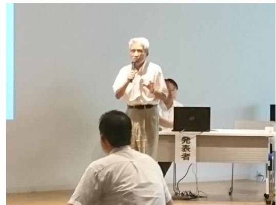
「道徳の授業のシステム化」小・中道徳