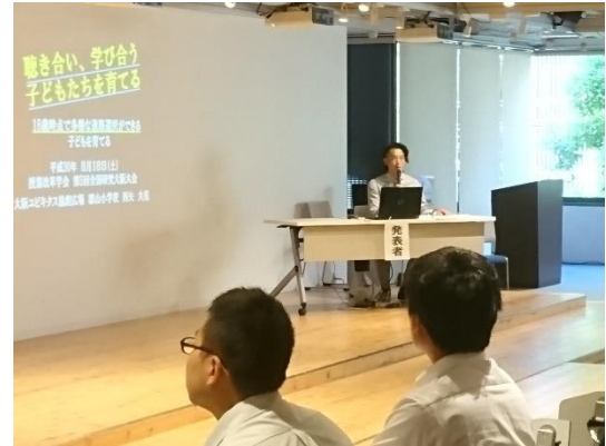
「聴き合い学び合う授業づくり」