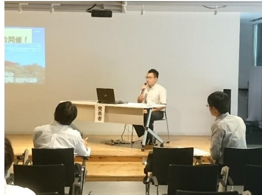
「江戸幕府“武家諸法度”の追究から認識力を高める授業」 中学社会